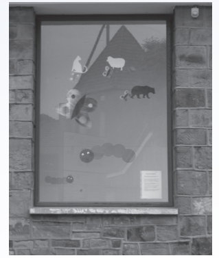
Dieses Bild findet ihr am Fenster der Kita und in der Riesterei!

Dafür legen wir in der Kirche vorgestaltete Zettel aus, die ihr mit Signalwörtern beschriften könnt. Dabei kann es sich um das Wachsen des Baumes handeln, ebenso wie um das Wachsen der Kinder!