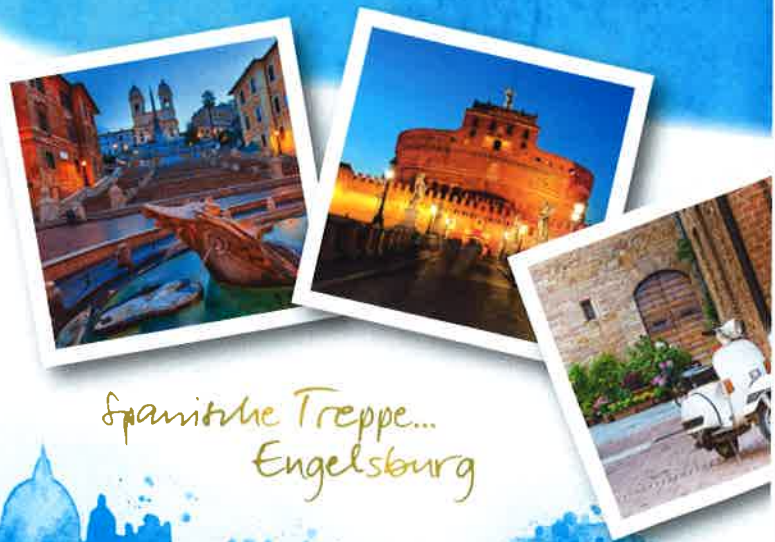
Spanische Treppe... Engelsburg

Eine Lichterfahrt durch Rom – „Rom bei Nacht“ – und ein Besuch im schönsten Stadtteil Roms „Trastevere“ sollten ebenfalls nicht fehlen.